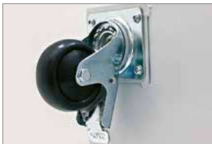
■ Kolečka, nivelační nožičky Příprava pro montáž koleček a nivelačních nožiček. Nivelační nožičky jsou příbalem rozvaděče