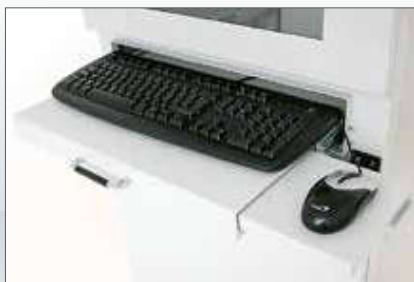
■ Výsuvná část pro klávesnici a myš