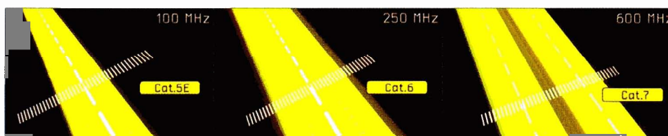
Rozdíl v šířce přenosového pásma tří výkonnostních kategorií strukturované kabeláže

než jak předpokládala původní norma ISO/IEC 11801 z roku 2002.